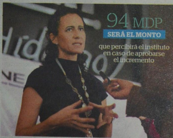
Vázquez indicó que estará dirigido a las asambleas ciudadanas.

De acuerdo con el proyecto presentado, el monto planteado deriva